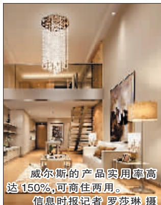
威尔斯的产品实用率高达150%，可商住两用。

上周六，位于珠江新城华强路上的富力威尔斯LOFT公寓正式对外发售，均价1.9万元~2.1万元/平方米。该产品具有4.8米的超高层高，是目前珠江新城在售的层高最高的LOFT公寓，也是珠江新城唯一在售的商务公寓。