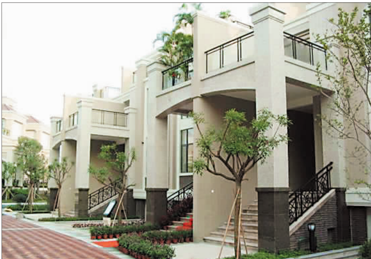
中海金沙熙岸主推别墅产品，售价仅为300~400万/套起。

据了解，此前中海金沙熙岸对外宣称的单套别墅的总价在400~1000万元之间，然而内部认购当