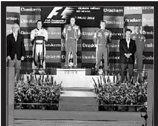
台上分站冠军 台下年度冠军

汉密尔顿就在他身后,如果英国人以第六名冲过终点,那么世界冠军将是法拉利车手马萨,但是鬼使神差的格洛克在最后时刻被汉密尔顿超越,让英国人拿到了第五,以最小的积分优势必败马萨赢得世界冠军。格洛克表示绝对没有故意“放水”的意思:“我一直集中精力在自己的比赛上,我不知道自己的位置这么微妙,而且直接影响到世界冠军归属。我试图取得最好的成绩,雨水再次光临后,我选择不换轮胎只是想跑到更靠前面的位置,但是我的轮胎抓地力没了。马萨冲线的时候,汉密尔顿仍排在第六,法拉利维修间甚至已经开始欢呼庆祝了。我真的不清楚汉密尔顿在哪超过我的,因为当时有4部赛车从我的左右超过,我当时只想把赛车安全的开回去。最后一圈之前我的圈速都在1分28秒左右,而最后一圈我跑了1分48秒,自己的麻烦都没有解决呢,根本没有时间顾及到其他车手的情况。”