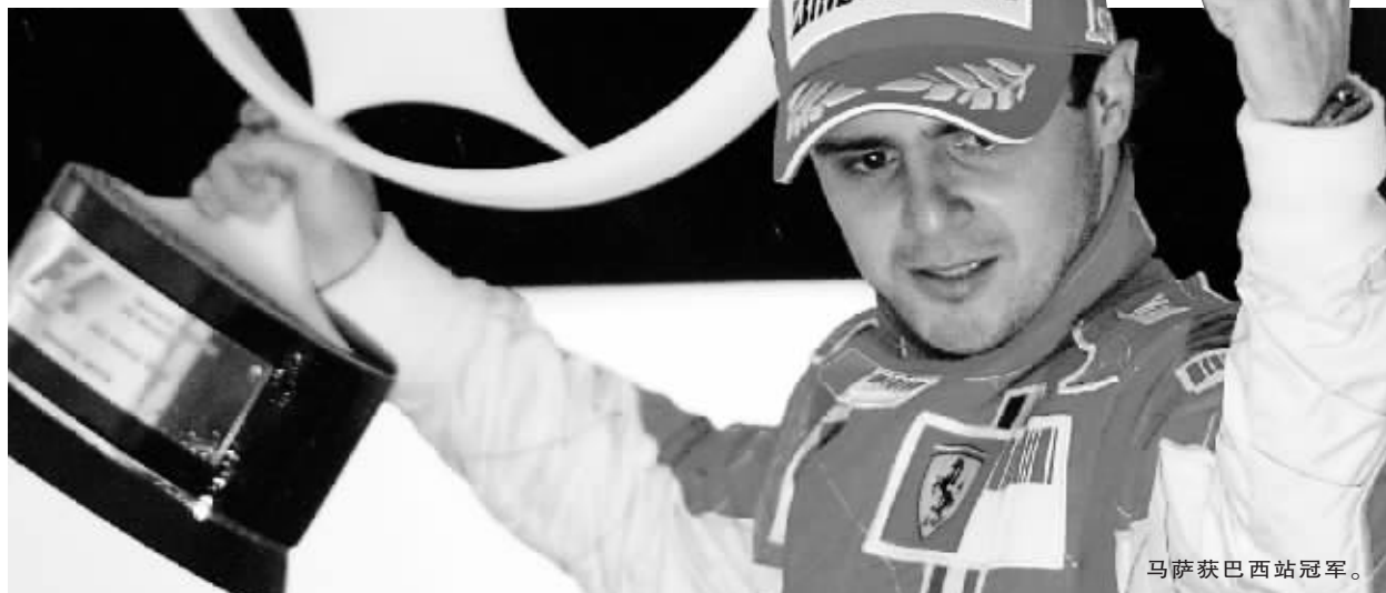
马萨获巴西站冠军。