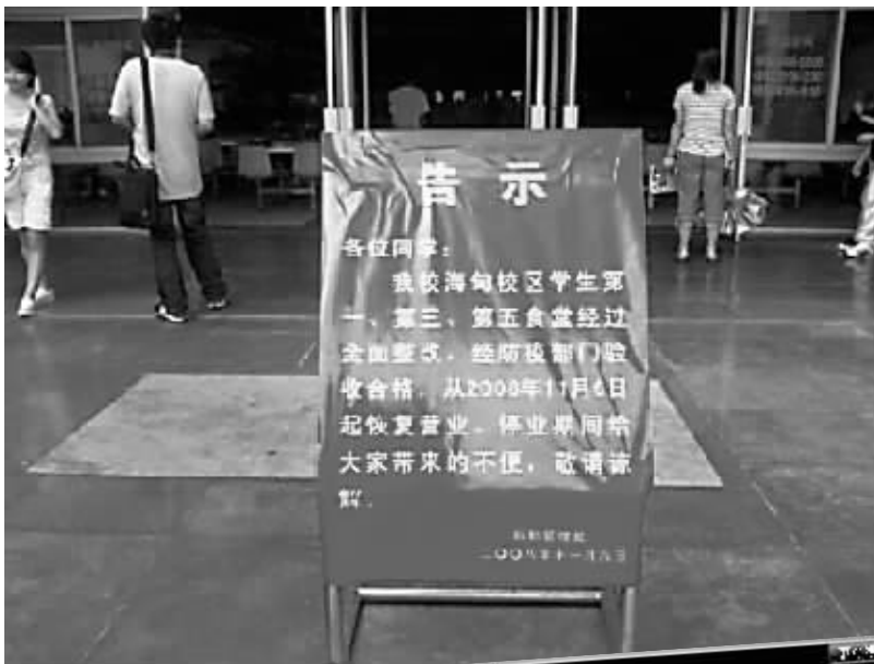
▲校方发布通告称,海南大学内的饭堂已经重新开放。

昨日,记者登陆用博客记录海大霍乱事件的网友“木子STYLE”的博客看到,一篇名为《11月6日,情况好转了》的文章刚刚发表。在文中,网友“木子STYLE”称,从昨日开始,海南大学内的饭堂已经重新开放,“早上起来的时候,听说食堂开门了,随后看到姐妹打了饭回来,很高兴。5天的泡面生涯似乎终于熬过了。在今天,很多人估计都可以吃到学校新鲜的饭菜了。”木子STYLE称。随后,木子STYLE还记录