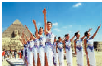
20年间，美在花城的足迹走向世界，2003年，赴埃及拍摄外景。

跨进新世纪以后，一些内地佳丽纷纷出国参加一些国际性选美比赛，取得了较好的名次，而“环球小姐”、“世界小姐”、“国际旅游小姐”等大赛也纷纷来中国举办，中国内地的“选美经济”极速升温。在传统选美的带动下，民间也兴起了一股选美热，服装模特、白领精英、旅游形象大使、城市形象代表、汽车模特、房展模特、内衣模特……几乎能够用得上美女的地方都搞过评选，“美女经济”已经成为中国一道靓丽的风景线。