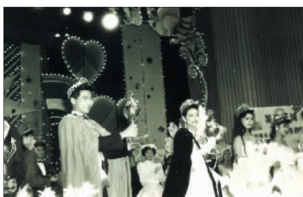
第二届美在花城获胜者。