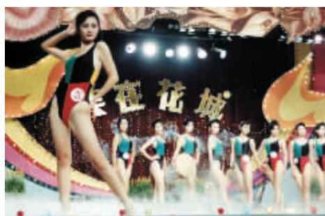
第一届比赛的复赛中女选手要穿泳衣展示身材在当时引起了轩然大波。

有趣的是，当年除了一些专业模特敢穿泳装展示身材外，许多选手还是穿长袖的体操服甚至宽大的运动服前来面试。一些女选手的男朋友不愿意让自己的对象参加比赛，甚至发匿名信“诬告”对方是三陪女，迫使主办方取消其参赛资格。为此，主办方不得不仔细调查部分选手的背景资料。虽说过程有些磕磕绊绊，但五十名初赛选手还是如期出炉。