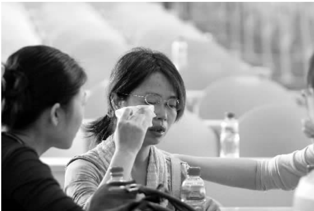
▲城东中学初三14班的女班主任，面对心理专家述说惨祸时泪流不止。

而目击警察开枪的老板张女士则夸那名警察是神枪手，她对记者说：“当时自己抱着小孩在店里，忽然看见一辆泥头车拼命的往下冲，一名警察则在后面追。当时情况非常危险，因为刚放学不久，很多学生正在附近买东西，随后看见警察在后面开了2枪，那辆泥头车司机当场就被击毙了。”