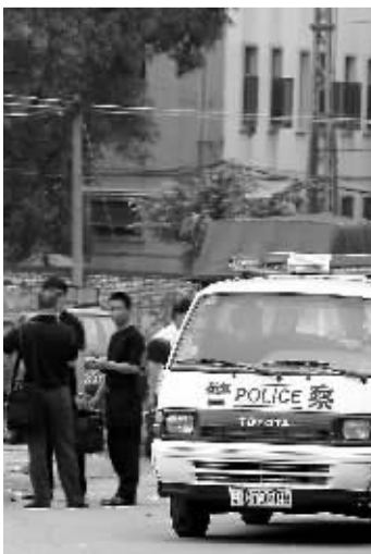
▼事发第二天早上，警方在击毙嫌疑人的现场再次勘察取证。