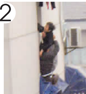
儿子帮助母亲站起。