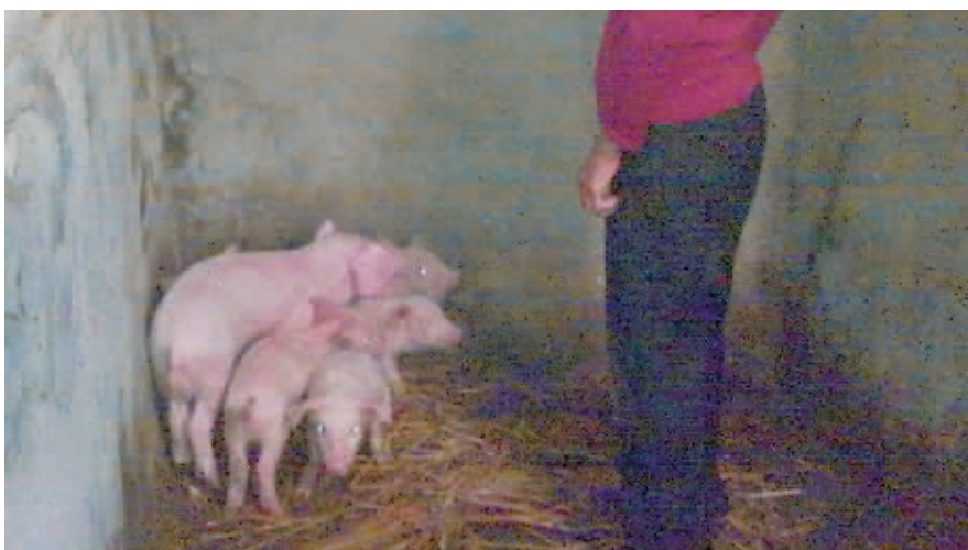
同胞猪仔，是否食用三鹿奶粉的身体大小差别很大。

宁德消委会一负责人介绍，他们要求，如果辖区的工商所遇到此类事件，首先要注重证据的收集，要依据当