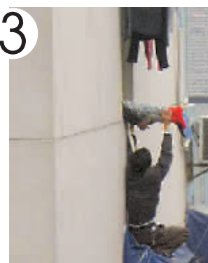
将母亲托进6楼阳台。