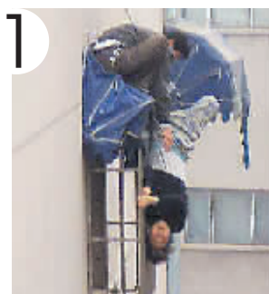
儿子系床单下去救母。