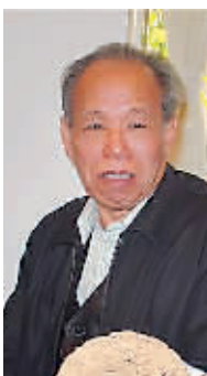
李定宁,牙雕大师,中国工艺美术学会高级会员,广东省美术家协会会员,1996年被授予“中国工艺美术大师”称号。