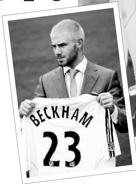
▲◀一样的装束,一样的造型,两个小贝,你能一眼认出孰真孰假?注意了现在公布正确答案,大图是小贝加盟洛杉矶银河时的正版新闻照,而小图则是“山寨小贝”拿着23号球衣的自我推销的见工简历照,果然是模仿能力超强的。