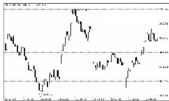
沪深300指数10分钟走势

微涨2点。下午早盘受港股单日转向带动迅速做好,保险股接力暴涨,石化双双发力,板块热点不断,最终以1677点收盘,升28点或1.7%。