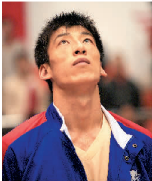
王晶也是一个外线投手。