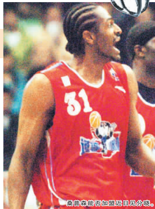
桑普森能否加盟近日见分晓。

对于新赛季几乎每支球队都将出现拥有NBA经历的外援,哈里斯也并没有感到压力大存在。“再次回到我的第二故乡打球,我在这里能够得到许多支持,因此我没有感到压力。我认为在职业篮球的圈子里,那里都会充满竞争。我并不会因为越来越来越多NBA水平选手的加入而想到退却。”哈里斯说。哈里斯表示在经过夏天的一系列系统而科学的训练之后,他感觉自己能够胜任除中锋之外的所有位置,对于新赛季他充满了信心。