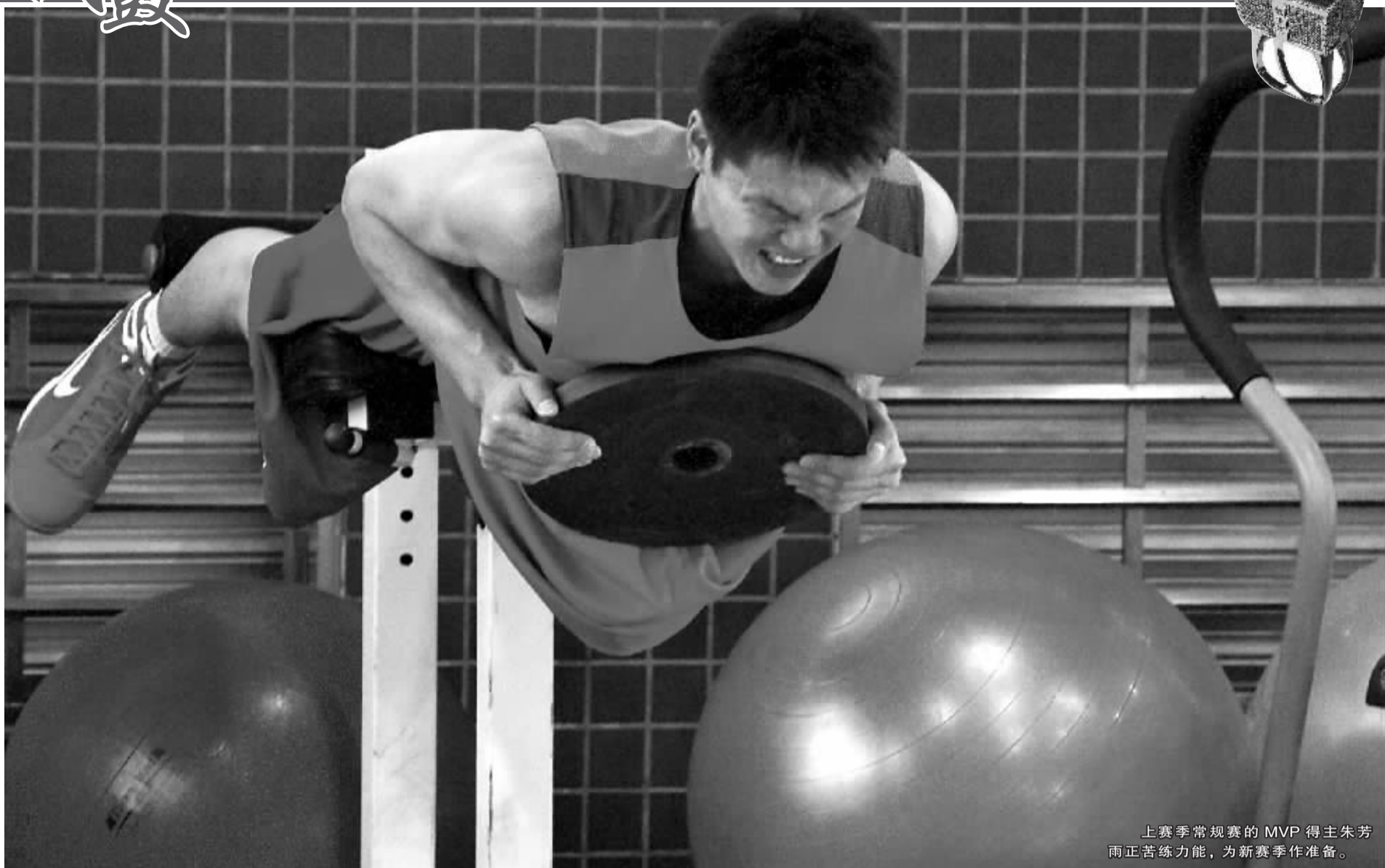
上赛季常规赛的 MVP 得主朱芳雨正苦练力能, 为新赛季作准备。