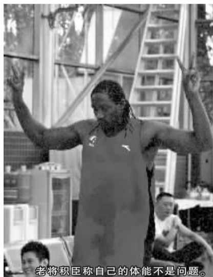
老将积臣称自己的体能不是问题。

“当我回到东莞的时候, 队友们都很兴奋, 我想这也是很自然的事情。当然, 他们会捉弄我一下。但不要紧, 我有的是时间报复。”放下董瀚麟时, 积臣一脸的坏笑。新赛季各队的内线可谓高手林立, 积臣年