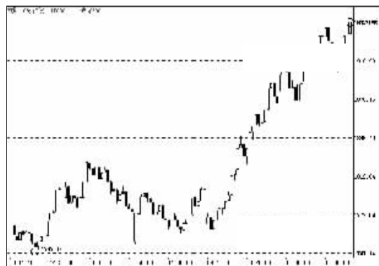
沪深300指数10分钟走势图