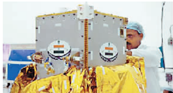
“月球飞船一号”所装载的月球撞击探测器