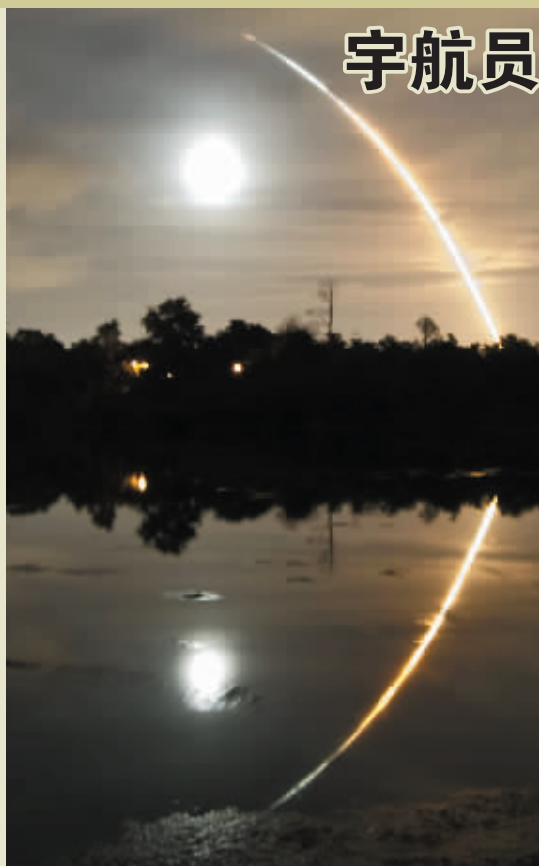
14日晚,美国“奋进”号航天飞机点火升空。

除了送去尿液循环机,7名太空人这次升空的最重要任务是为空间站送去新厕所、厨房、冰箱、新的训练装置以及两个供宇航员睡觉的新设施,替空间站进行有史以来最大规模的内部装修,届时满足常驻人员从现在的3人扩编至6人的需要。