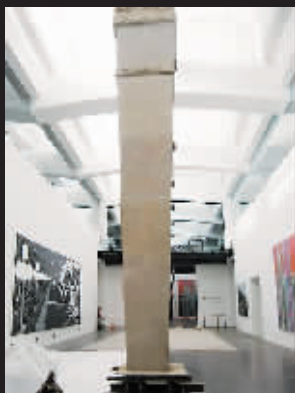
刘韡作品《被连根拔起的方尖碑》