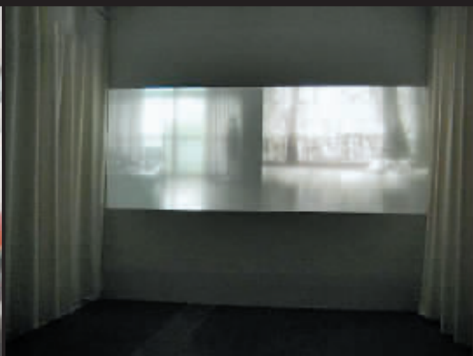
曾御钦双频录像作品《我痛恨假设》