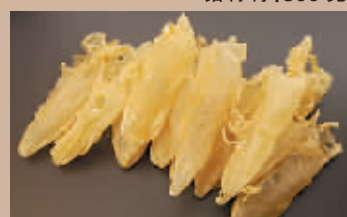
花胶:150克(中小身材3个)