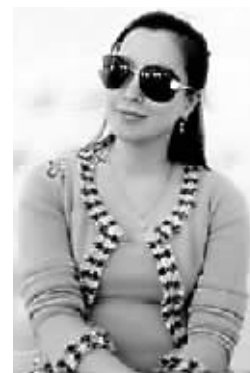
金喜善终于有“孕味”啦。

据韩国媒体报道,金喜善在怀孕6个月的时候,身材依然保持良好。不仅受邀拍摄了一组时装宣传照片,还被当时的工作人员赞叹“神奇的孕妇”。如今已怀孕8个月的金喜善小腹高隆,孕味十足。虽然没有化妆,但还是会被人一眼认出来,脸没有因怀孕而变大,只是眼