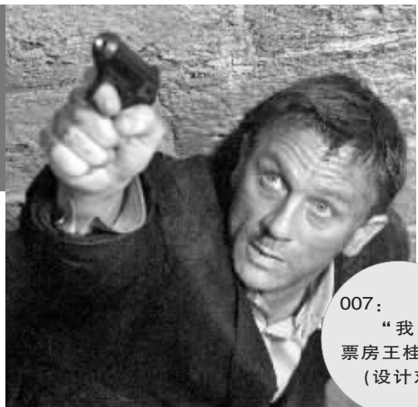
007:“我枪指票房王桂冠。”(设计对白)

票房分别达到1450万港元和2604万元人民币。至于《量子危机》在内地的总票房,据统计已达1.1亿~1.2亿元人民币左右,该片堪称今年11月名副其实的票房大鳄。