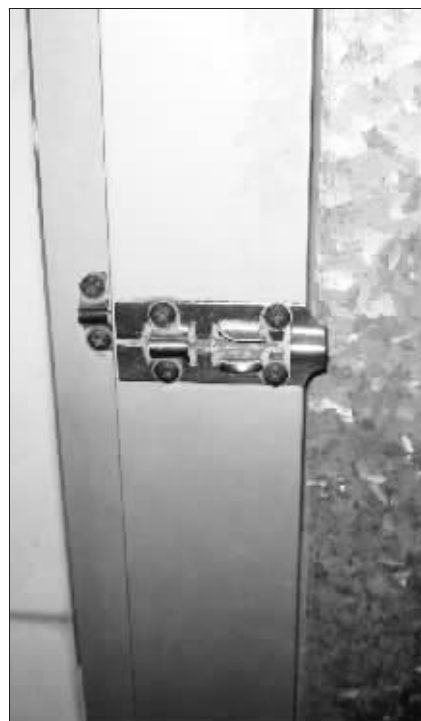
门闩被损坏无法关上,在记者调查的免费公厕中很常见。

走在大街上突然内急而又找不到公厕的尴尬,相信很多人都有经历过,那份尴尬与狼狈,真叫有苦说不出。记者在采访中发现,不少市民认为广州街头公厕太少,标志不明晰,在一定程度上给他们的日常方便增添意外的小烦恼。