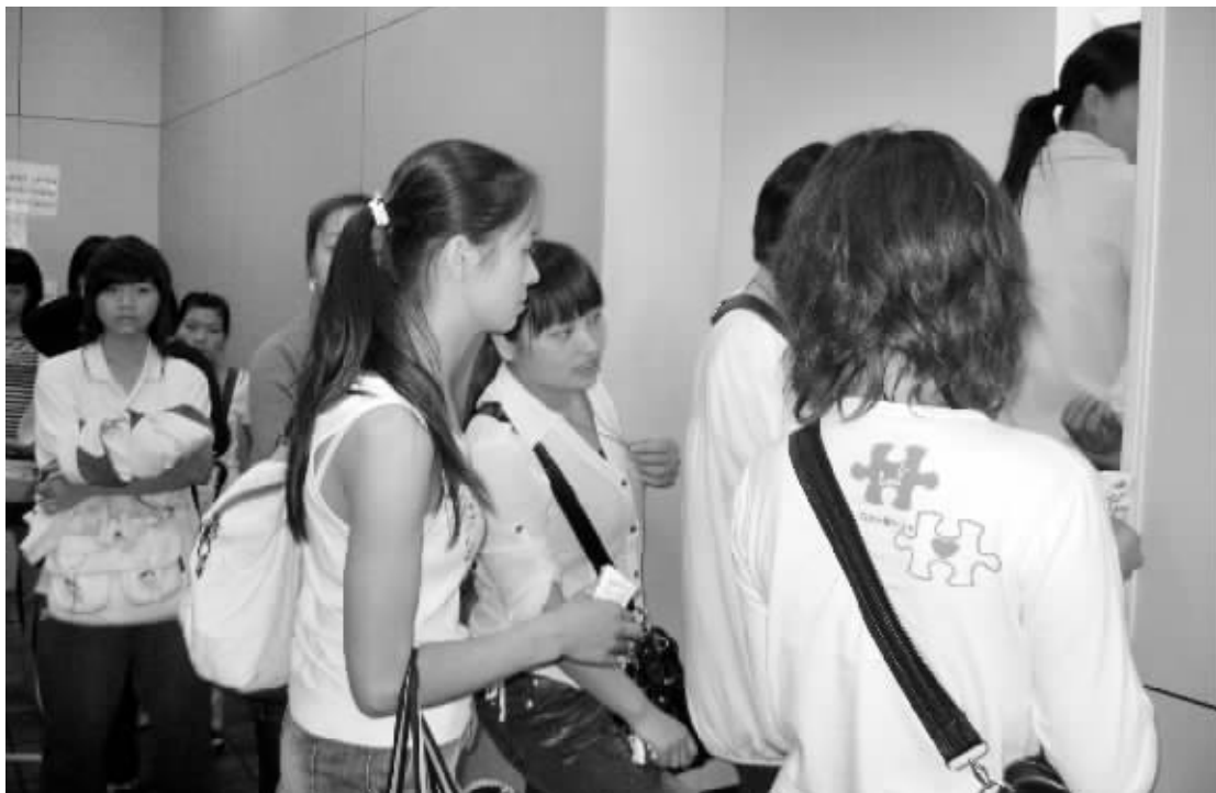
女厕门口打排长龙,是各大商场、快餐店的常见场面。图为火车站旁的 KFC 餐厅厕所门前景象。