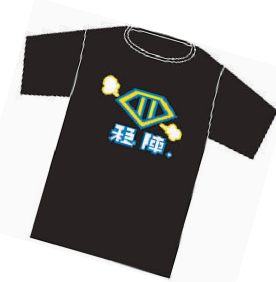
广州市7中高2某班班服的设计样图——“稳阵”压倒一切!