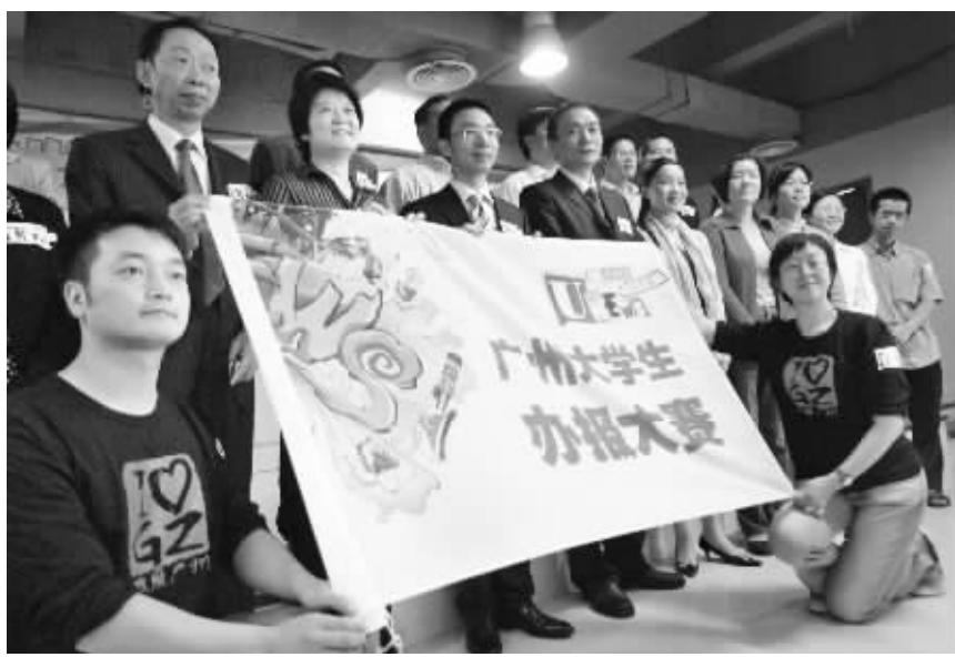
各高校代表出席首发式并在广州大学生办报大赛旗前合影。

“希望该报使尽可能多的年青朋友领略到办报的无限精彩,同时我们也希望一批未来的办报精英能在这个办报平台脱颖而出,从而使这个事业长盛不衰,后继有人!”