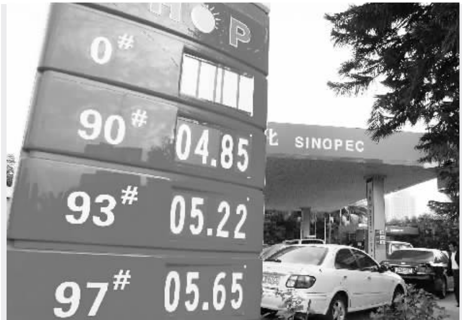
油价的变动牵引着众多车主的心。

为何油价迟迟不能下调呢?该人士表示,国际油价跌破 90 美元之前,两大石油公司已持续近半年的亏损期,目前,国际油价刚刚跌破拐点不足两个月,尚需一段时间复元。但他预计,零售价下调是必然的。