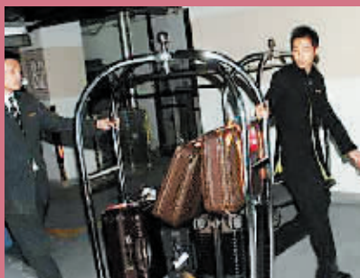
李嘉欣带了 5 大箱行李去上海,据说其中一箱装满了育儿的书籍。

李嘉欣昨日以水晶婚纱造型出席活动,并未戴上传说中的 8 克拉钻戒。