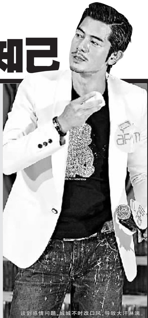
谈到感情问题,城城不时改口风,导致大汗淋漓。