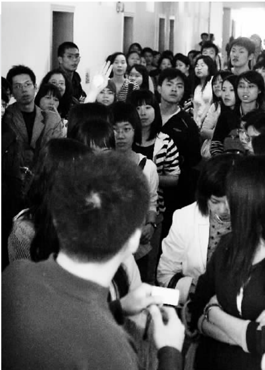
今年初,教师资格证可面向社会人员认定的消息刚传出,大批毕业生到高校报名修读《教育学》和《教育心理学》,甚至通宵排队,盛况空前。

有些申请人在读时曾经获得普通话等级证书,但毕业后已经遗失的,可向原发证单位申请补发。