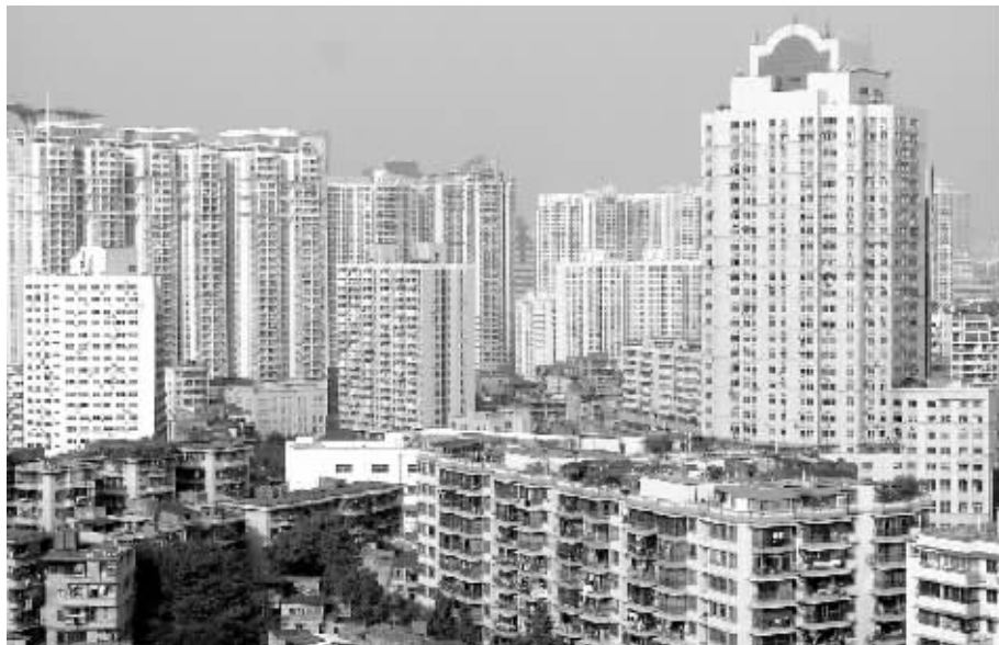
广州市海珠区商品房一景。

仅推出1块。而且,接下来广州即便要引入社会力量建设,估计地块规模都比较大,资金总投入额高,因此本较愿意拿项目的中小企业也没有资金能力。此外,广州市土地出让合同新版,已将经适房配建比例纳入其中条款。但有关人士表示,考虑到今年楼市低迷,配建计划可能搁浅。