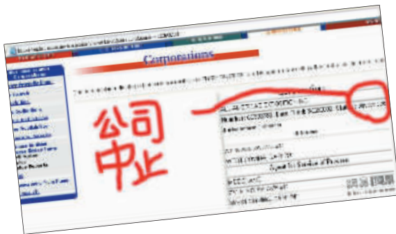
美洲集团被当地政府中止营业的信息。

近日一个题为《我无意中捡到的某市公务员出国考察费用清单》的帖子引起网民的极大关注。前日,一个题为《温州公费旅游团更多秘密曝光》的帖子出现在凯迪社区,同样引发网友热议。发帖者称,通过搜索而查寻到接待江西新余、浙江温州两个官员公费旅行团的美洲集团是个皮包公司。