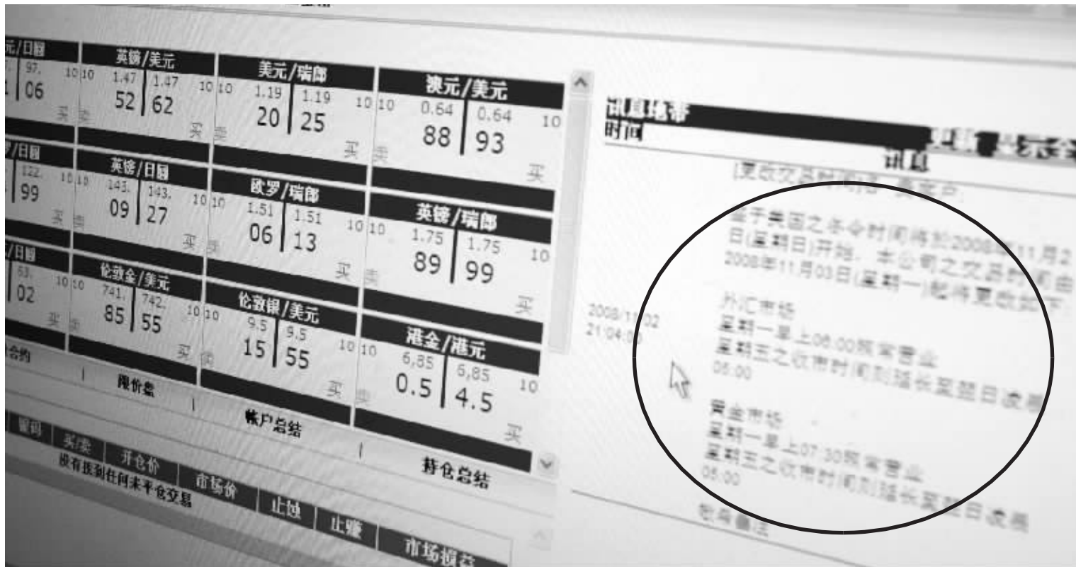
地下炒金操作平台上提供的黄金价格往往与国际黄金市场报价不同步,让你在错误的参考数据引导下作出错误投资。