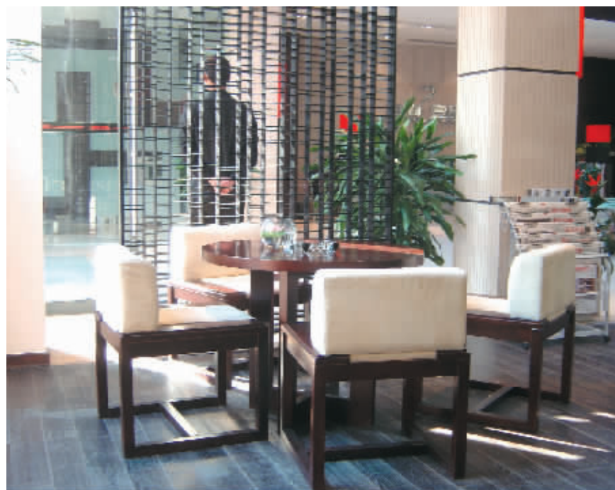
楼市低迷,售楼处处可见“虚位以待”的场景。(资料图片)

业内人士则认为,二次房贷没有松动造成了买家持币观望。某地产商分析,能消化目前楼价的多为二次或者二次以上置业的买家,如果政策对他们不松绑,观望气氛仍将持续。统计数据显示,今年以来,广东居民存款增幅呈现逐月放大态势。至今年10月末,全省中外资金融机构本外币存款余额达54639.20亿元,增长16.0%;居民储蓄存款余额达26997.50亿元,增长24.7%,增幅同比提高27.6个百分点。韩世同认为,这个数据说明越降息市民越不敢消费,尤其