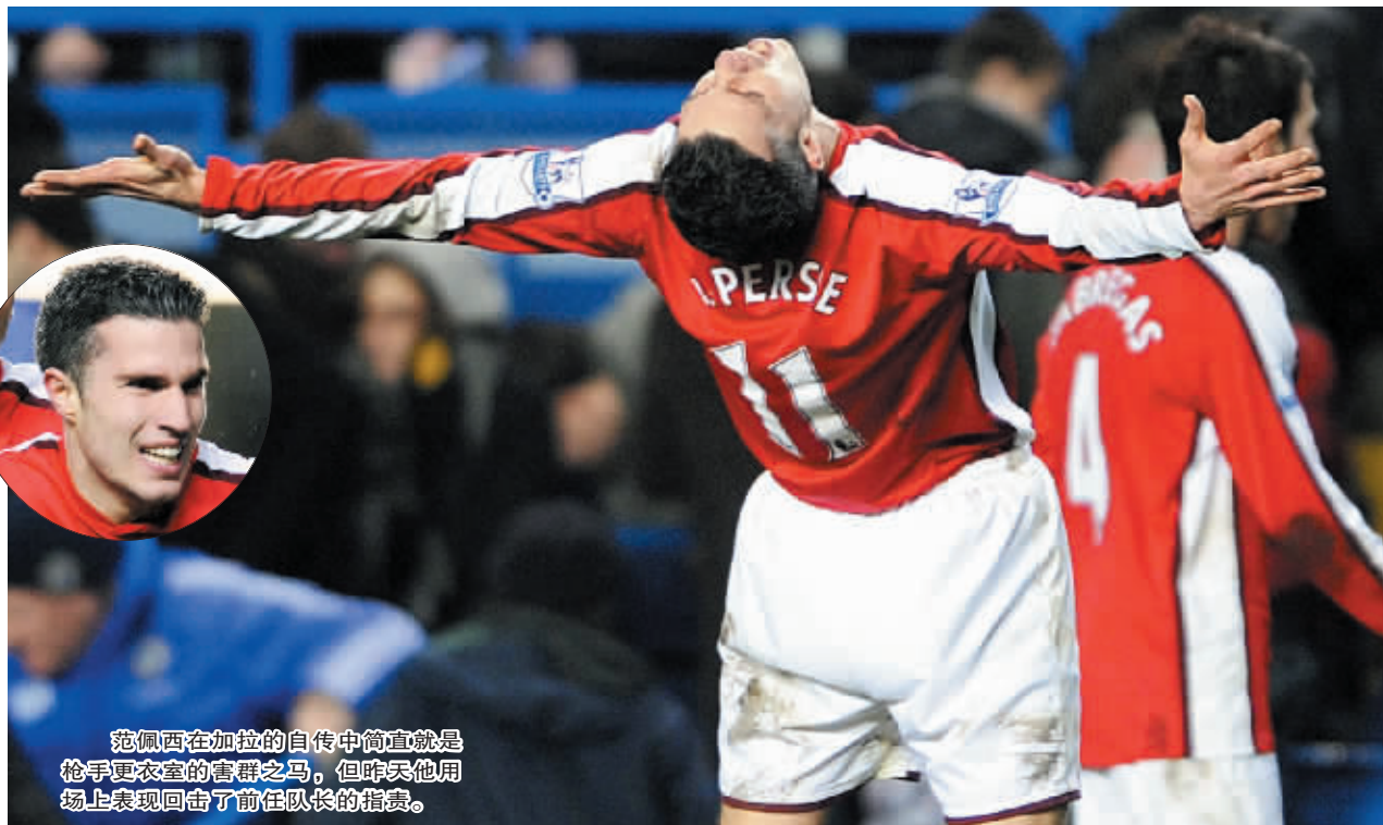
范佩西在加拉的自传中简直就是枪手更衣室的害群之马，但昨天他用场上表现回击了前任队长的指责。

信息时报讯 在战胜切尔西之后，温格的球队开始叫人看不懂了。这支此前连续输给维拉和曼城的球队，此役遇到领头羊切尔西反而变得异常凶悍。昨天凌晨，做客斯坦福桥的年轻枪手们2:1逆转对手，硬生生地从蓝狮军团身上抢得3分。这场伦敦德比之后，双方的分差缩小至7分，成绩反弹至第四的阿森纳仍在争冠行列中。