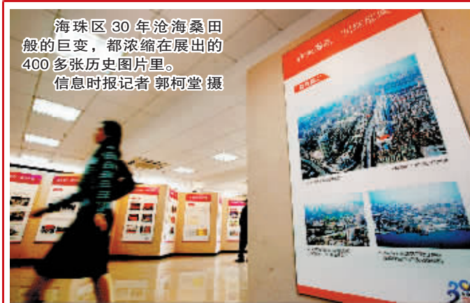
海珠区30年沧海桑田般的巨变,都浓缩在展出的400多张历史图片里。

据悉,自费飞行员与公费飞行员最大的不同是,自费飞行员在报考上没有高考成绩的限制,只要参加南航的英语科目的考试即可。大学本科在校生和研究生也可来报考。2009年南航在英语考试上将引进托业考试项目。自费生毕业后没有学历学位文凭,但只要考取民航总局认可的驾照就可以与南航签约,成为一名正式的飞行员。