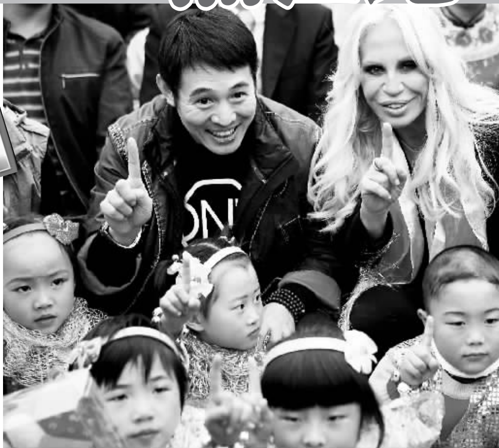
上个月,李连杰与著名服装设计师范思哲一起到四川看望灾区儿童。