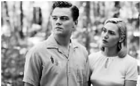
莱昂纳多与温斯莱特的奥斯卡前景被看好。