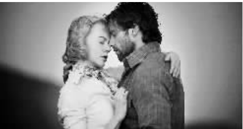
妮可的新作《澳大利亚》的奥斯卡前景不太妙。