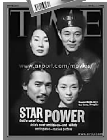
李连杰6年中两次登上《时代周刊》亚洲版封面,上次是以武术家身份,这次是以慈善家入选。