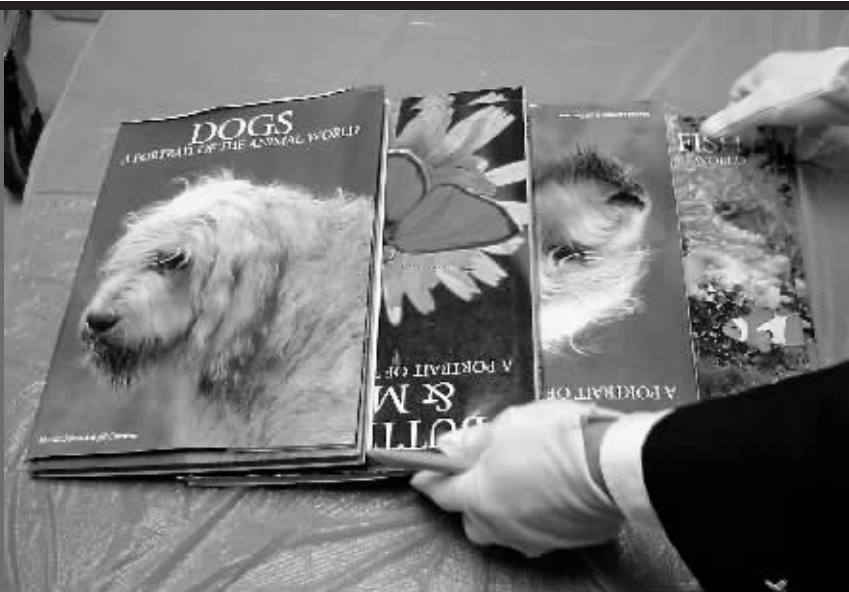
四本书比一般的书籍重,且书的封面和封底略厚一些,通过对话,海关关员发现当事人神情紧张,决定开拆。

信息时报讯 (记者徐毅儿 通讯员 郑云) 记者昨日从广州白云机场海关, 该关连续查获4宗行李夹藏毒品走私案。从查获的案件情况显示, 国际贩毒团伙大量利用东南亚籍人士采取行李夹藏方式走私毒品, 并不断变化藏匿手法。