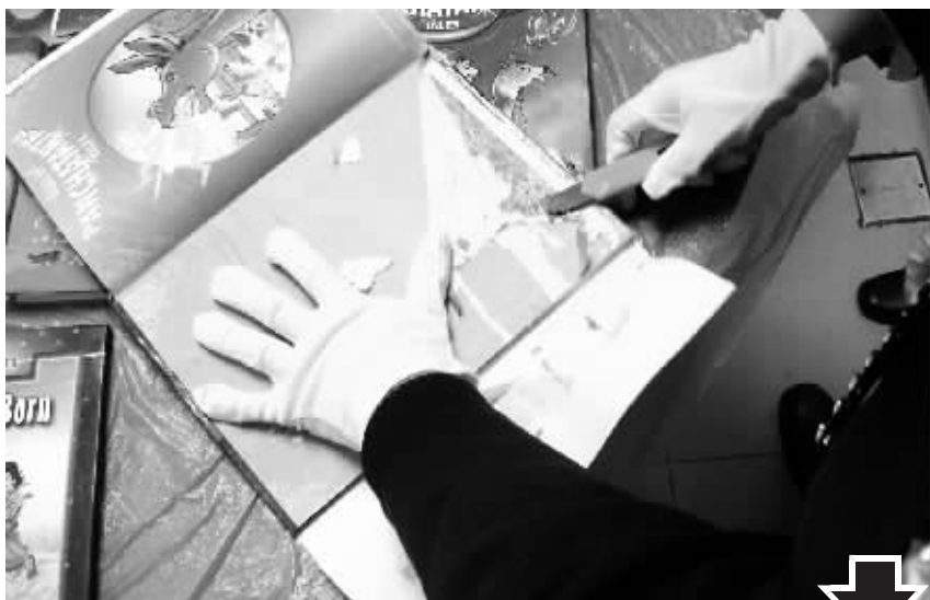
割开书的封面后, 薄薄的一层夹层出现在眼前!

几天后, 走私分子试图故伎重演, 12月15日和17日, 机场海关又连续在来自东南亚的航班上查获两名东南亚籍旅客利用硬皮书封面利用行李夹藏走私海洛因入境的案件, 手法类似。