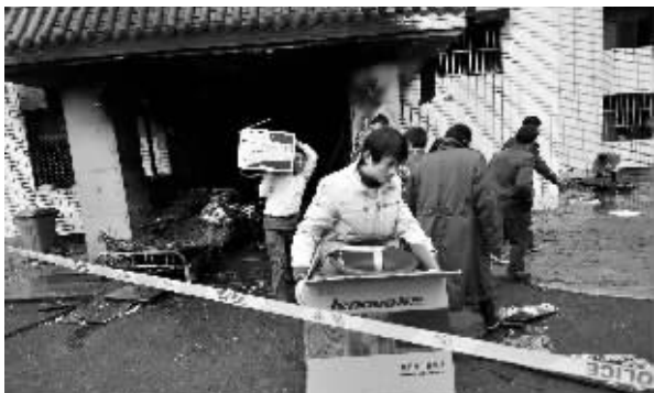
▲图为火灾发生地,长丰县水湖镇长丰宾馆,1栋4层楼。