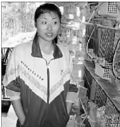
“本人啦,我是个养兔子的,这是我的兔房”。