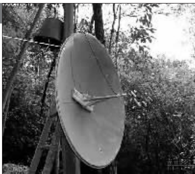
自制的定向天线,无线路由器放在倒置的桶内。

亦有不少网友认为应该用宽容的眼光看待“养兔女”讲述的这件事情,不管是否属实,如果照片中的这名女孩真的曾经尝试打通“信息化富裕之路”,就算精神可嘉了:即使证明是吹牛蒙人,也不希望这是什么意图打造另外网络红人的推手在背后搞作,毕竟“她貌似还在上学,别玷污了这种清纯。” 李斌