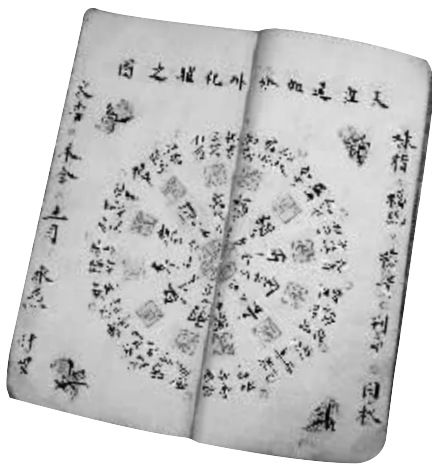
文锦堂家传国学天盘注解