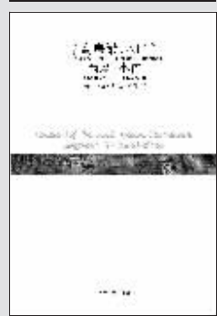
(美)J.D.塞林格 著 人民文学出版社 2009年1月