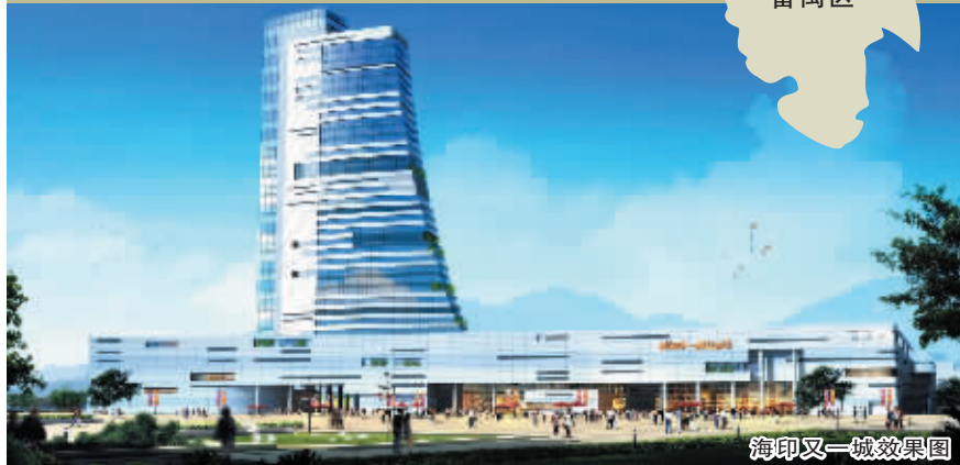
海印又一城效果图

海印又一城项目位于番禺南村镇番禺大道里仁洞路段,投资15亿元,打造的一个面积超过25万平方米,集购物、展览、办公、酒店、餐饮、娱乐、休闲于一体的大型商业中心项目。