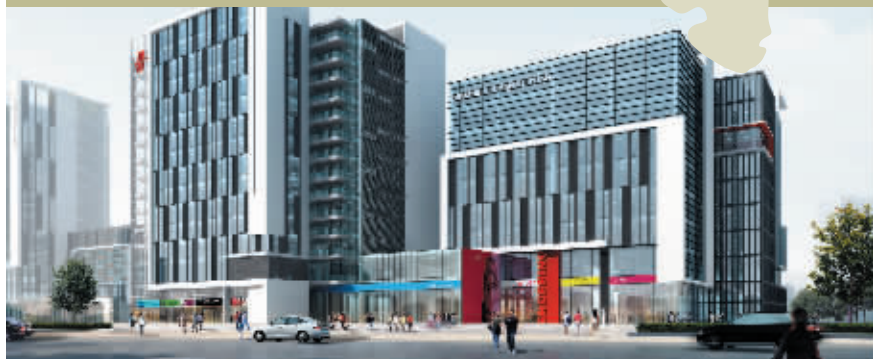
中颐·创意产业园效果图