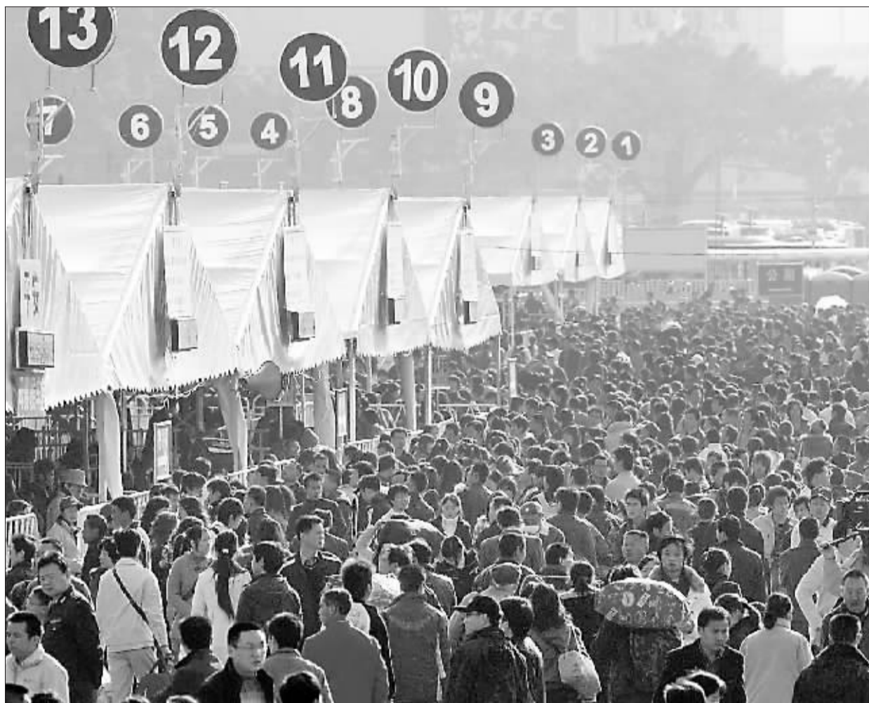
昨日,广州火车站广场的人流量7000多人,距离容量底线还有很大距离。

春运首日,广州火车站、东站等秩序井然。广州站开行79列,日发送量15万~16万人,东站开行124列,所有列车均正点始发。再加上临客88列,共送客62万人次,其中出省31万人。昨日,广州站还开行了首趟外来工团体专列护送1410名外来工返乡。广州站送客量与去年同比略有增加,因为今年春运每天14趟列车约直接在珠三角北上。公路客运方面,全市34个客运站场共计划开行班车2.3万班次,客流没有明显增长,运力不到50%,几乎所有线路的营运班车都能当日购票乘车。