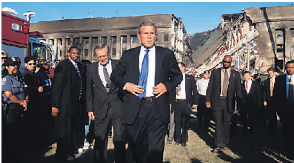
2001 年 9 月 12 日，布什和拉姆斯菲尔德来到五角大楼视察撞机现场。

这次袭击事件也是美国自二战以来本土首次遭到袭击，死伤者数以千计。而在“9·11”中，布什及其幕僚的表现也不尽如人意：总统布什得知消息后在众目睽睽之下发了半晌呆；当天晚上，“鹰派”的国防部长拉姆斯菲尔德就在紧急会议上公然摊牌称将进攻伊拉克，原因只是阿富汗目标不够大，不足以证明美国强大的军力。