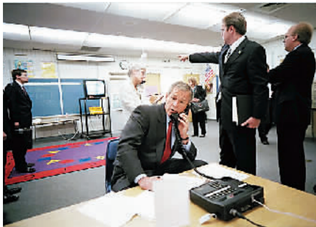
布什在“9·11”发生后不久后在学校与白宫通电话。