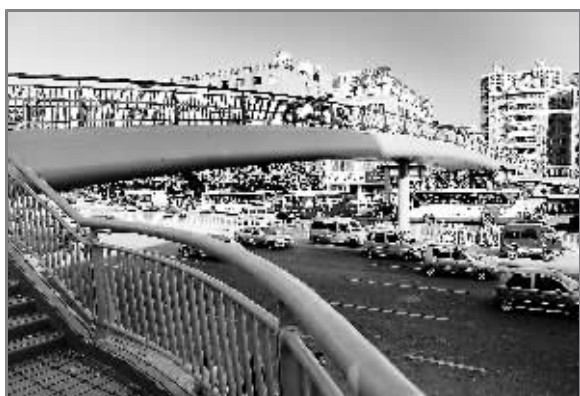
南洲路天桥是广州市目前跨度最大的钢结构人行天桥,现已进入桥体安装阶段。

越秀区作为广州市的中心城区,对全市创建全国文明城市工作承担着重要的责任和义务,广州没能入选“全国文明城市候选名单”,说明我们的工作还没有达到全国文明城市的标准。回顾三年来的创建工作,越秀区进行了深入思考和总结。在这次广州参评全国文