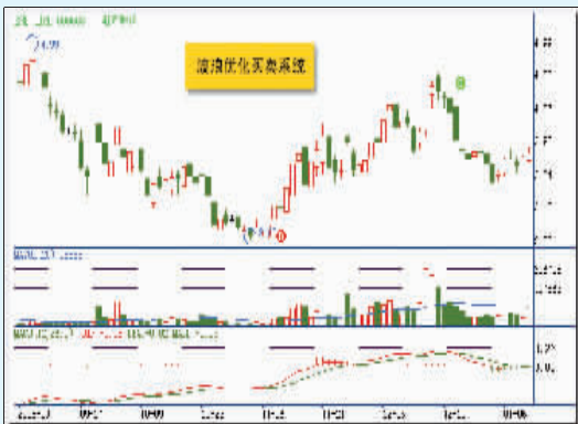
东期间内,拥有优先认购保持其第一大股东地位的权利。Reco Shine Pte Ltd的实际控制人是新加坡政府产业投资有限公司,是新加坡政府

阳光股份(000608)公司通过增发,Reco Shine Pte Ltd由此成为公司第一大股东。在该公司成为阳光第一大股