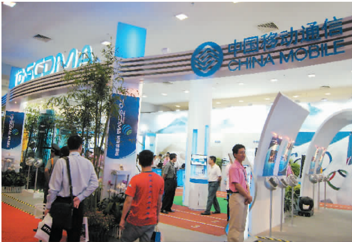
中国移动获得TD 3G牌照标志TD开始正式商用。

据记者了解,由于800元一个月的话费实在太多,因此即使一些电话非常频繁的用户也难以用完。记者采访了数位通话量很大的TD用户,发现几乎没有人能将试商用话费用完。