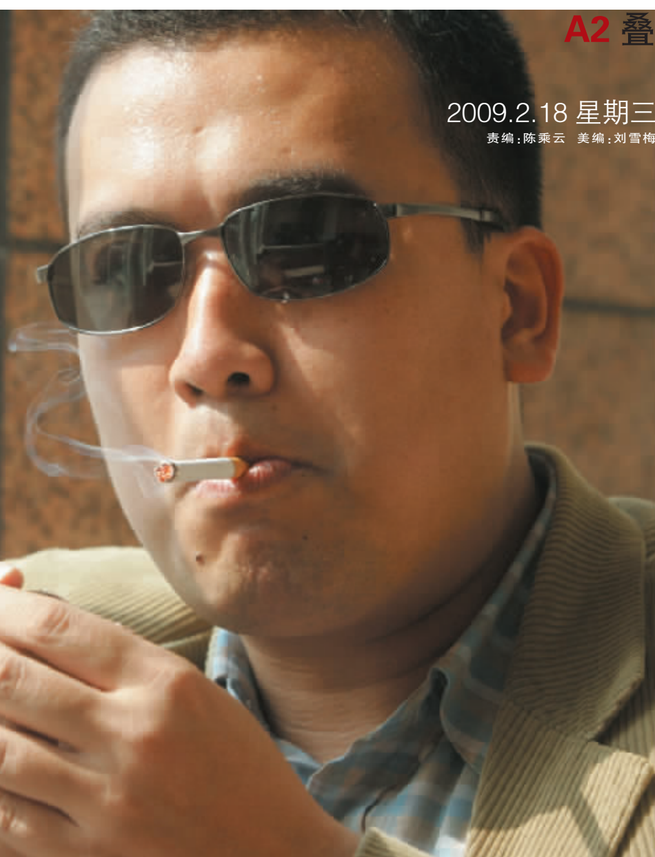
住田公司执行队长在接受记者的采访,该公司最近在江边打出巨幅广告引人关注。