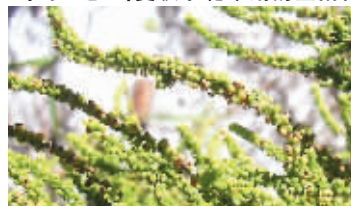
“杀手”之一:夏秋季花果期的土荆芥。

广州由于对外交流和进出口贸易频繁,加上气候温暖,已经成为全国外来入侵生物种类最多的城市之一。广州有多少种外来入侵植物?它们在广州“嚣张”到何等程度?华南植物园的专家们做了一次大调查发现,广州的外来入侵植物已经达到73种,其中11种危害严重,正在排挤甚至杀死本地物种,原来在我们的身边,在我们无知无觉的时候,植物们却在上演激烈的“生死决战”。