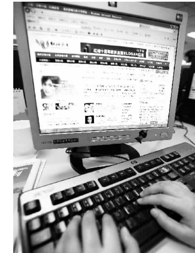
在红袖网上,月入4万的“天后”级写手也不过七八人。

目前,这个没有多少生活经历的大一男生已经写完了五部长篇小说,他两个月就能完成一部。往往坐在电脑前的第一分钟,他的头脑还是一片空白,还不知道要写什么,而坐下来后,劈劈啪啪地在键盘上乱敲一气,灵感就来了,想到哪就写到哪里。现在,他正在网络上写一部不知道多长的长篇小说,目前完成的字